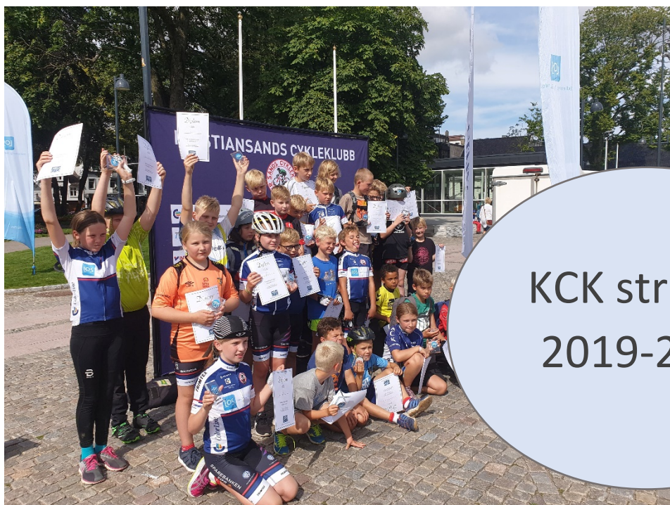
Figur 1 KCK strategi 2019-2022